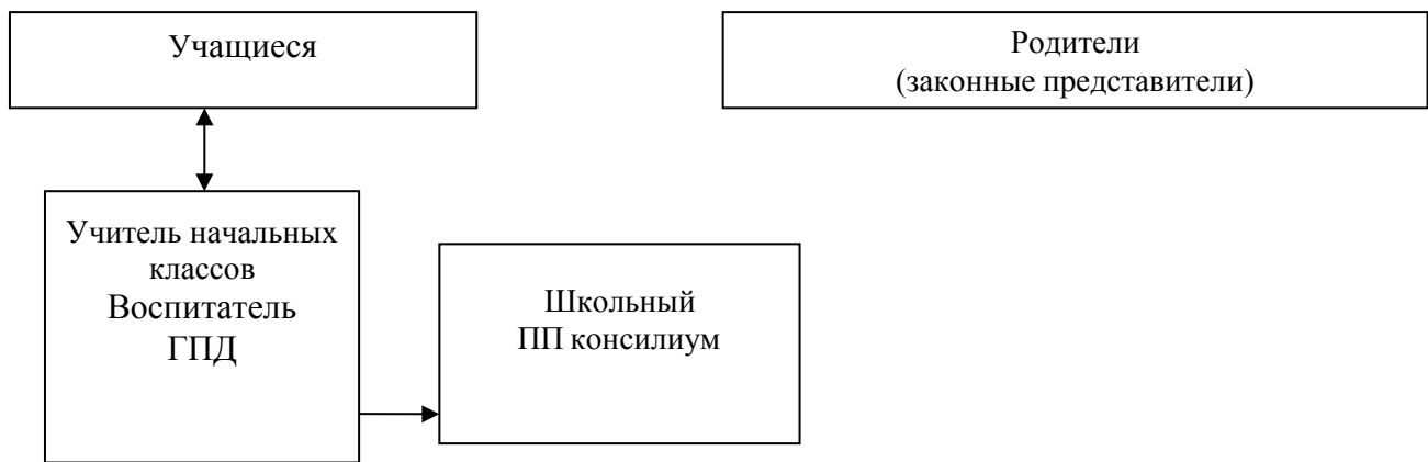
Рисунок 1. Модель взаимодействия педагогов и специалистов

Особое место в модели взаимодействия педагогов и специалистов общеобразовательного учреждения занимают родители (законные представители) учащихся с умственной отсталостью (интеллектуальными нарушениями) в решении вопросов их развития, социализации, здоровьесбережения, социальной адаптации и интеграции в общество.